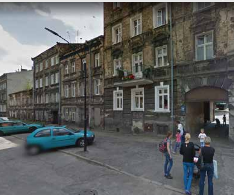
ul. Jabłkowskiego przed zmianą ↘